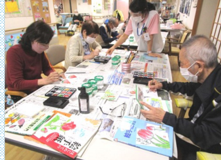
書道・絵手紙・水彩画・水墨画教室