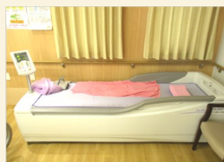
リラクゼーション